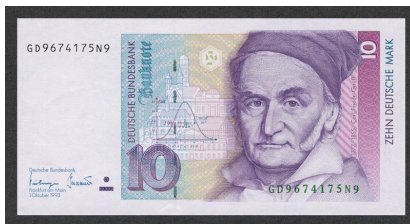
Figure: Alemaniako markoaren billete bat, non Gauss eta banaketa normala agertzen diren.

XVIII. mendetik ezagutzen da, Abraham de Moivre eta Pierre-Simon de Laplace matematikariei esker. Carl Friedrich Gauss matematikariak aplikatu zuen lehen aldiz, errore astronomikoen arloan. Horregatik, Gauss-en kanpaia edo banaketa gausstarra ere deitzen zaio.